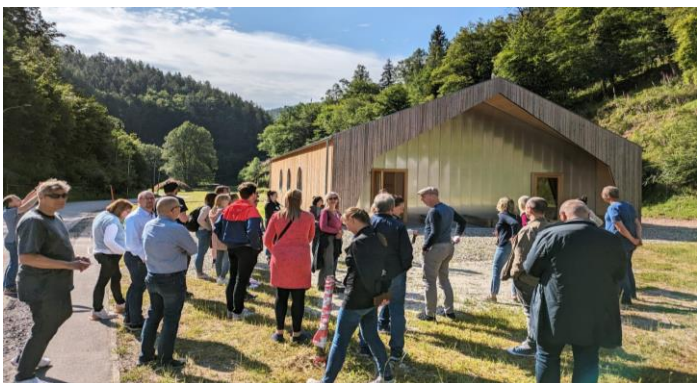
LEADER-Bundestreffen am Holzbaucampus

Im Juni 2024 fand das LEADER-Bundestreffen in Kaiserslautern statt. Ziel war die Vernetzung und der Austausch von LEADER-Akteuren aus ganz Deutschland. Am zweiten Tag des Bundestreffens wurden verschiedene Exkursionen in die umliegenden LAGn durchgeführt. So hatten die Regionalmanagerinnen und -manager die Möglichkeit, sich ein Bild von unserer LAG zu machen und drei Projekte zu besichtigen: Der Holzcampus im Diemersteiner Tal, der Sonnenweg in Enkenbach-Alsenborn sowie die Weinlounge Zellers in Albisheim.