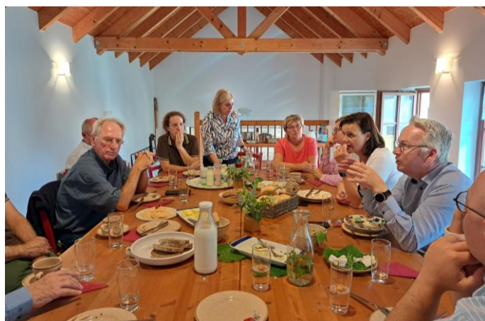
Delegation RAG Kyffhäuser, Ziegenhof Peter

Tourismus und die Entwicklung von Dorfkernen gesprochen und mögliche Kooperationspotentiale beleuchtet. Begleitet wurde dieser Austausch durch verschiedene Projektbesuche. Einen Abschluss fand die Exkursion im Ziegenhof Peter, einem ebenfalls geförderten LEADER-Vorhaben.