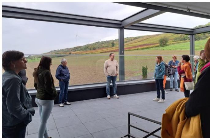
Regionalmanagerinnen und -manager im Zellers in Albisheim

Im Oktober hießen die LAGn Donnersberger und Lautrer Land, Westrich-Glantal, Soonwald-Nahe und Rheinhessen eine Gruppe hessischer Regionalmanagements in der Pfalz willkommen. Am zweiten Tag wurden verschiedene Projekte in unserer LAG besichtigt und von den jeweiligen Projektverantwortlichen vorgestellt. Besucht wurden das Zellers mit einem Ausblick auf den neuen Spürnasenweg in Albisheim und der Holzbaucampus im Diemersteiner Tal.